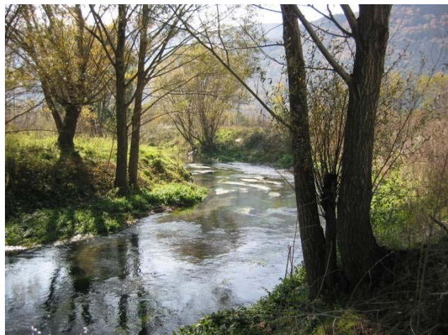
FOTO DELLA STAZIONE

Da Campobasso imboccare l'uscita in direzione Roma-Napoli (S.S. 17) percorrendo seguendo le indicazioni per Bojano - Isernia - Roma. Proseguire per Bojano ed entrare in città, percorrere Via Cavadini (fino alla scritta Benvenuti a Bojano) e girare a sinistra verso via S. Antonio Abate, dopo circa 600 mt in località "Pietre Cadute" effettuare il prelievo.