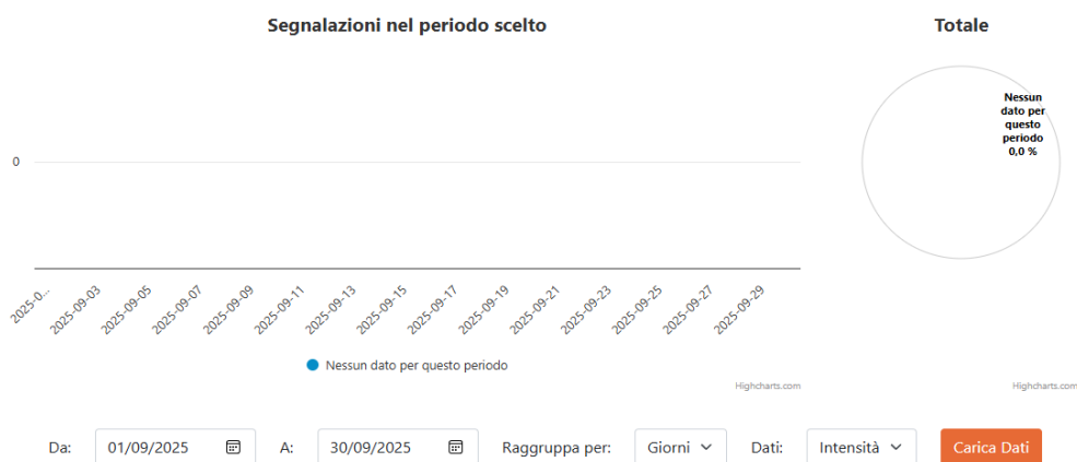
FIGURA 2 – SEGNALAZIONI CAMPOCHIARO-SAN POLO MATESE. SETTEMBRE 2025