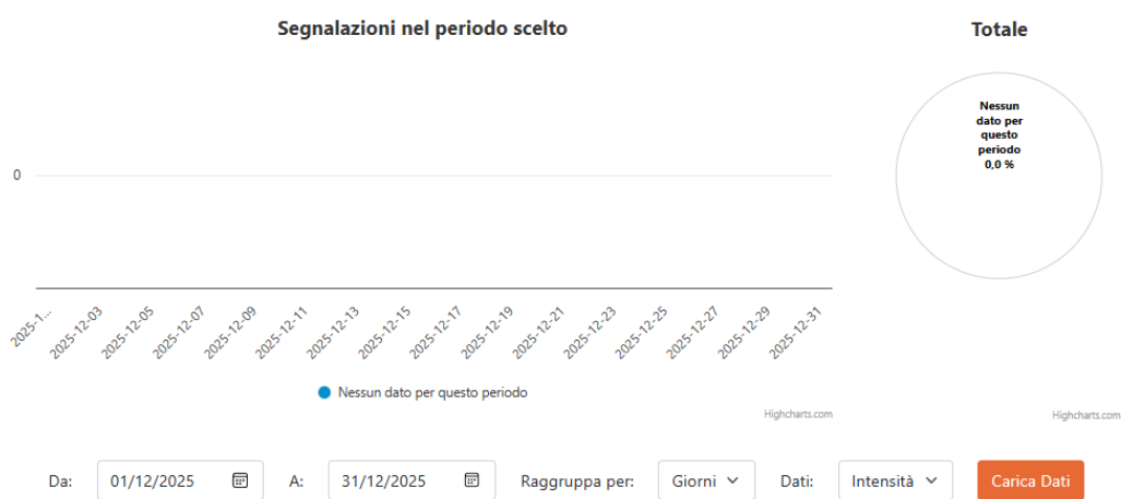
FIGURA 3 – SEGNALAZIONI PIANA DI VENAFRO. DICEMBRE 2025